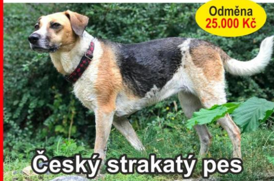
Český strakatý pes

kdekoliv na Moravě a příhraničí Slovenska