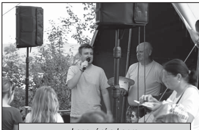
Losování o kapra