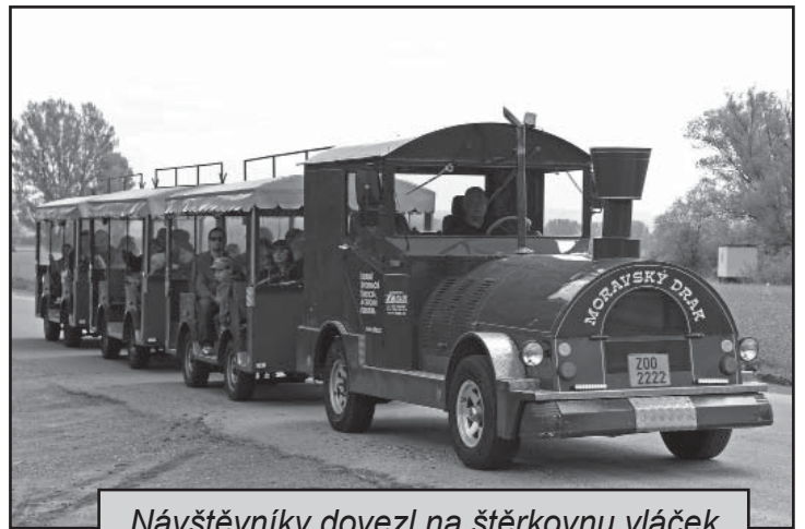
Návštěvníky dovezl na štěrkovnu vláček