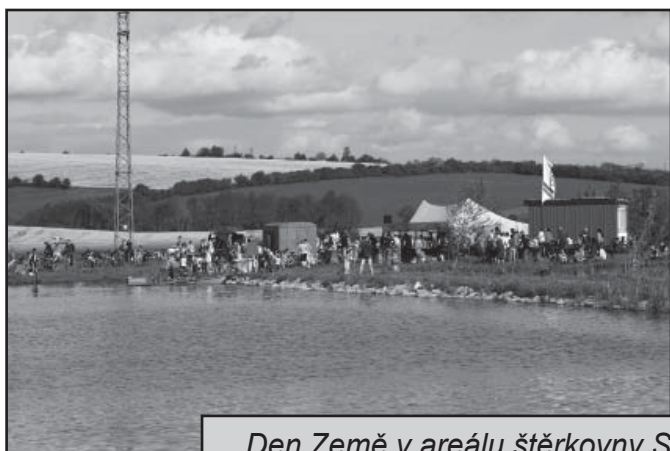
Den Země v areálu štěrkovny Spytihněv společnosti CEMEX Sand

Společnost CEMEX si jako výrobce surovin a souvisejících výrobků uvědomuje své zásahy do přírody, ale také svou úlohu dodavatele pro stavební průmysl. Proto klade důraz na využívání přírodních zdrojů co nejšetrněji, snaží se co nejvíce chránit přírodu a usiluje o hospodárné využití zásob surovin včetně funkčního zapojení vytěžených ploch do krajiny tak, aby byly využity pro přírodu, rekreaci a jiné. Při rekultivaci oblastí po ukončení těžby kameniva jsou dodržena všechna zákonná nařízení a požadavky.