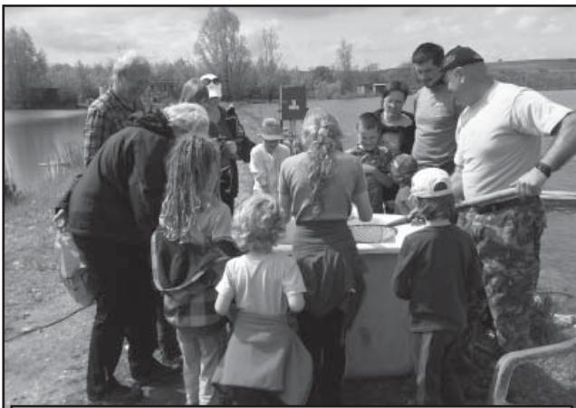
Ukázka živých ryb vyskytujících se v areálu