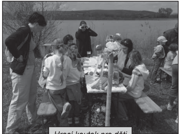
Hrací koutek pro děti