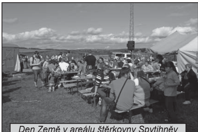
Den Země v areálu štěrkovny Spytihněv společnosti CEMEX Sand